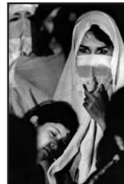
Alger, juillet 1969