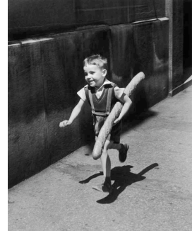
Le petit parisien, 1952

Né en 1910 à Paris, Willy Ronis est tout de suite plongé dans la photographie, son père ayant son propre studio «Roness». Photographe essentiel, il est le représentant éminent de la photographie humaniste, mondialement reconnu. Il affectionnait les sujets sociaux, montrant la vie simple et heureuse des gens ordinaires mais aussi les luttes et les grèves des ouvriers. Il a signé des nus délicats, dont son célèbre «nu provençal». Ces photos sont marquées par une composition soignée, une grande maîtrise de la lumière héritée de son goût pour la peinture hollandaise et plusieurs sont devenues des icônes.