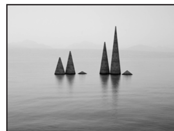
Monuments, China air and water pollution 2001