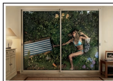
Stihl garden tools, Publicis Conseil Paris