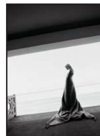
Nadja Auermann pour Hermès, Trouville, juin 2003