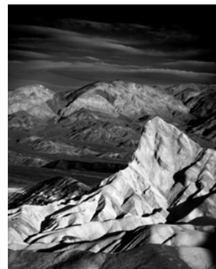
La vallée de la Mort, Etats-Unis