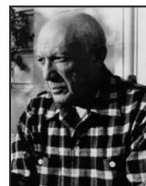
Pablo Picasso