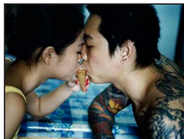
Singapour, les HDB