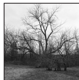
Arbre Canada